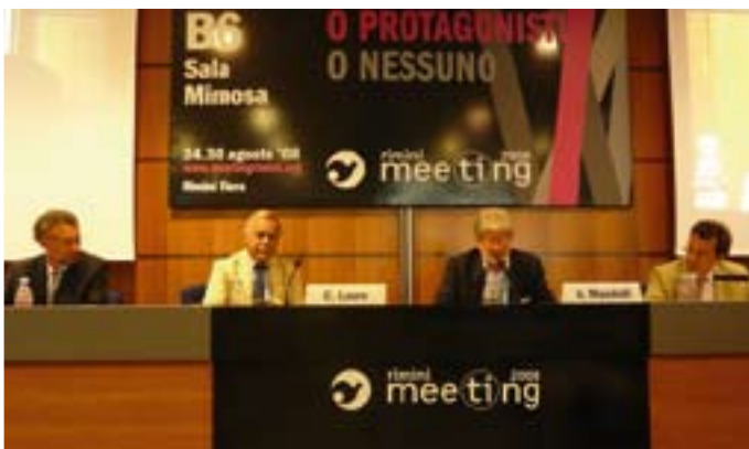
Il tavolo dei relatori