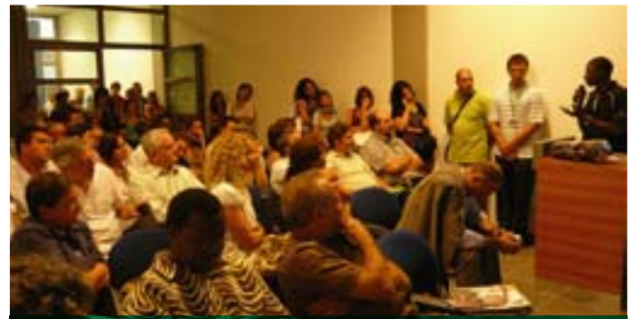
Una testimonianza durante l'appuntamento di AVSI

> AVSI INCONTRA I SUOI PROTAGONISTI Giovedì 28 agosto Un incontro tra protagonisti dei progetti e protagonisti in solidarietà. Mondi lontani che spesso si incontrano via mail o attraverso video o documenti descrittivi. Così, nei padiglioni della Fiera di Rimini al Meeting i protagonisti sui due fronti hanno avuto modo di raccontarsi a vicenda. È ormai un appuntamento consolidato che vorremmo sempre più incentivare.